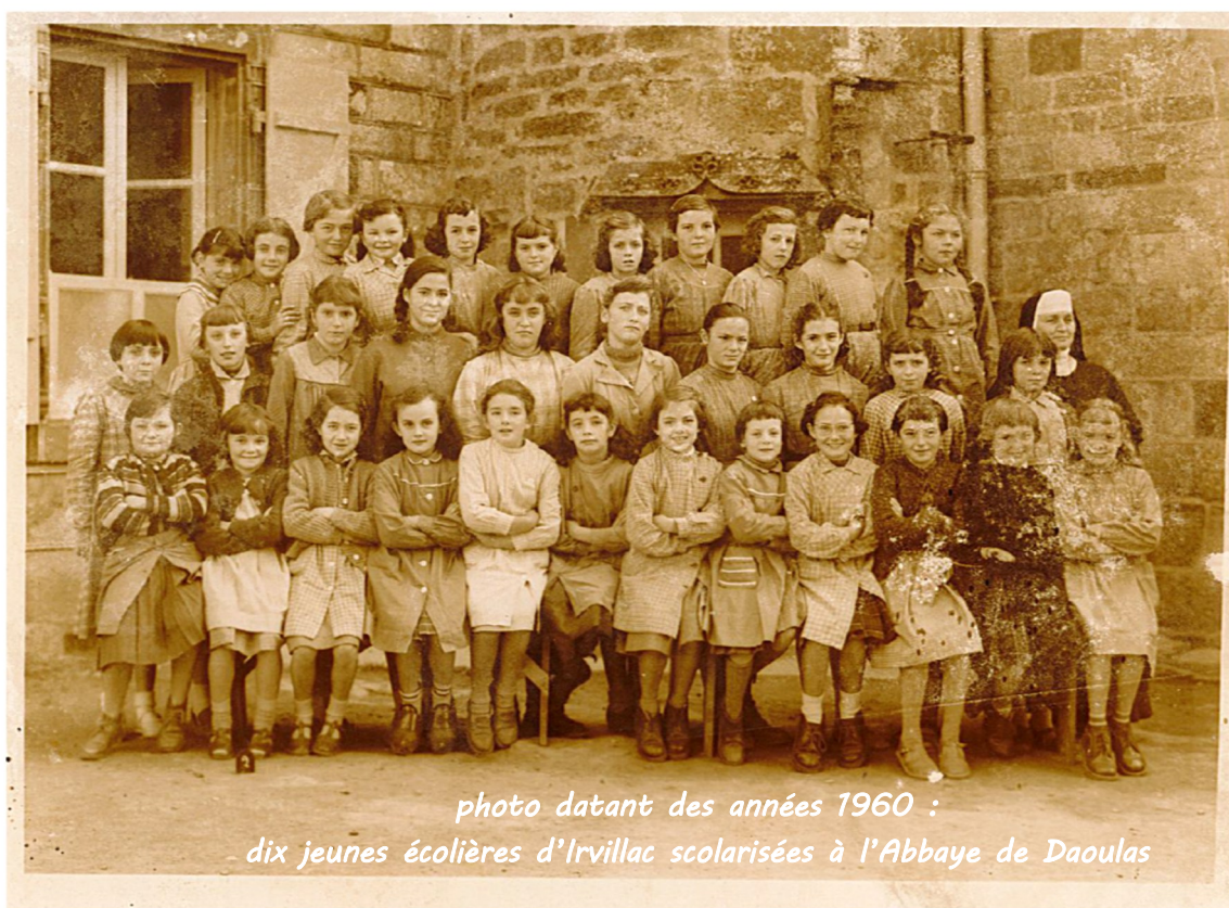
photo datant des années 1960 : dix jeunes écolières d'Irvillac scolarisées à l'Abbaye de Daoulas